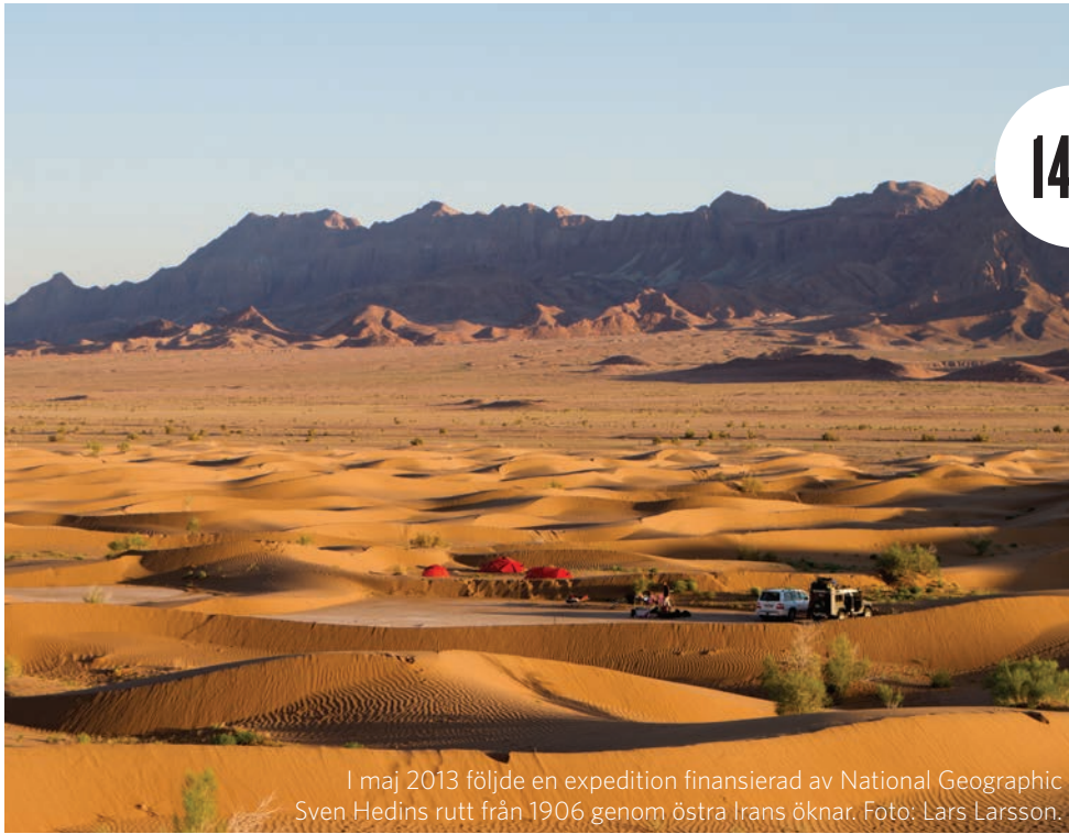
I maj 2013 följde en expedition finansierad av National Geographic Sven Hedins rutt från 1906 genom östra Irans öknar.